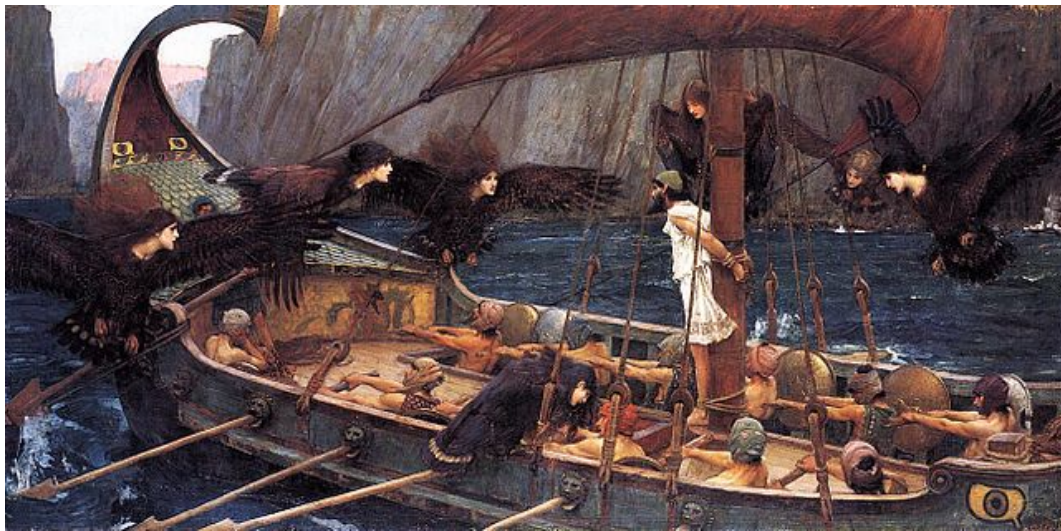
Das Prinzip der Mythenrezeption: Die Sirenenpassage. — JOHN WILLIAM WATERHOUSE: Ulysses and the Sirens (1891). National Gallery of Victoria, Melbourne.

Wo Götter, Helden oder auch gewöhnliche Menschen in Liebe entflammen, sind sie bald schon zu allem bereit. Dabei zeigen sie Züge, die man ihnen eigentlich nicht zugetraut hätte. Sie wachsen über sich hinaus, geraten aber auch außer sich, unternehmen alle erdenklichen Anstrengungen und wechseln sogar ihre Identität, was nicht immer gut ausgehen muß.