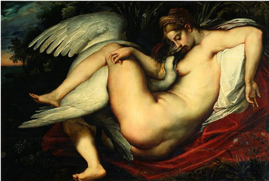
PETER PAUL RUBENS: Leda and the Swan (1598f). Staatliche Kunstsammlungen Dresden.

Neugeborenen, solange bis diese sich selbst helfen können. — Im Hintergrund steht das Trauma von ZEUS, der selbst vor seinem eigenen Vater KRONOS und vor den TITANEN verborgen wurde, bis er nicht nur seinen Vater, sondern auch die ganze vormalige Weltordnung überwinden konnte. Genau diesen Schutz wird er wieder und wieder auch seinen Nachkommen angedeihen lassen, was allerdings nicht immer von Erfolg gekrönt ist.