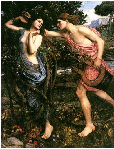
JOHN WILLIAM WATERHOUSE: Apollo and Daphne (1908). Privat.

Alle Vorstellungen über Liebe haben eines gemeinsam, sie ist als schicksalhaftes Ereignis eigentlich unerklärbar. Also greift der antike Mythos zum Bild eines rechtsunmündigen Knaben, der aus dem Hinterhalt mit Pfeilen auf seine Opfer schießt.