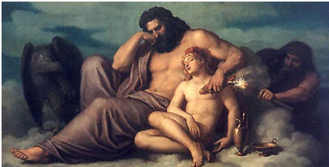
ZEUS und GANYMED, eng umschlungen. Im Hintergrund PROMETHEUS, der das Feuer stiehlt, in dem er es am Blitzbündel entfacht. — CHRISTIAN GRIEPPENKERL: Der Feuerdieb (1878).

das Zeugen und Etablieren neuer Lebensformen, während HERA diesen neuen Nachkommen unerbittlich nach dem Leben trachtet.