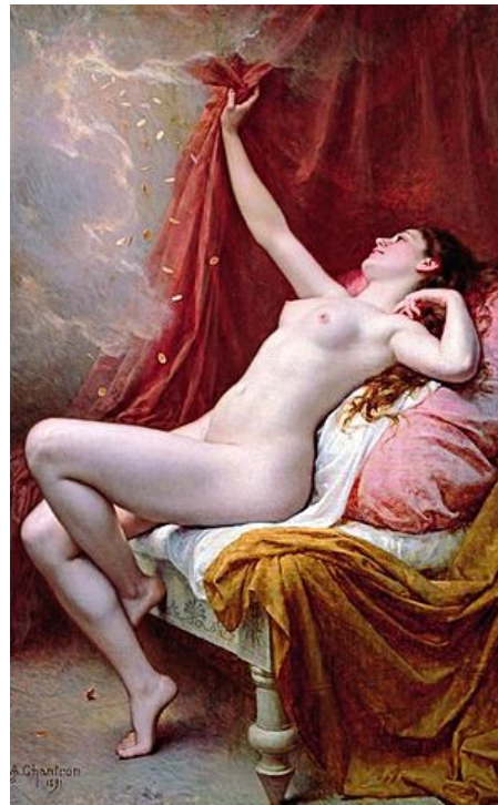
ALEXANDRE JACQUES CHANTRON: Danaë (1891). Museum of Fine Arts, Rennes . — Quelle: Public Domain via Wikimedia .

Die Rede der Diotima — Platon und die Stufen der Liebe — Penia und Poros: Eros — Éros, Philía, Agápe — Philosophie der Liebe — Anima und Animus — Leda und der Schwan — Europa und der Stier — Orpheus und Eurydike — Daphne und Apollon — Das Urteil des Paris — Amor und Psyche — Philemon und Baucis — Venus und Adonis — Daphnis und Chloe — Perikles und Aspasia — Hermaphroditos — Monogamie, Polygamie, Polyamorie — Aktuelle Diskurse.