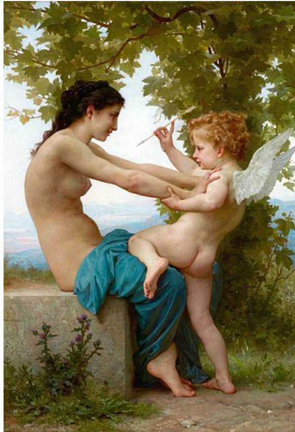
WILLIAM-ADOLPHE BOUGUEREAU: A Girl Defending Herself against Eros (1880). The Getty Center, Los Angeles.

tan, Orientierungsorientierung zu liefern. — Da sämtliche dieser Figuren und Erzählungen nicht selten bis ins Extreme gesteigert sind, gilt es, auf die Hintergründe zu schließen, um jede Menge an Erfahrungen zu sammeln.