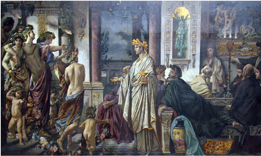
ANSELM FEUERBACH: Das Gastmahl des Plato (1873). Staatliche Kunsthalle Karlsruhe.

Im Dialog zwischen DIOTIMA und SOKRATES wird eine Phänomenologie der Liebe entwickelt, die in ihrer Stufenfolge immer höher steigt. Treibendes Element ist die Liebe zur begehrenswerten Schönheit — im Anderen. Den Anfang macht die Eigenliebe als Bedingung für die Möglichkeit, überhaupt lieben zu können. Darauf folgen einfachste Formen des Begehrens, eben rein sexuelle Begierde. Aber allmählich kommen der oder die Andere(n) nicht mehr nur als Objekt, sondern als Subjekt in den Blick. Das Spektrum weitet sich immer mehr, so daß die Liebe selbst immer umfassender wird.