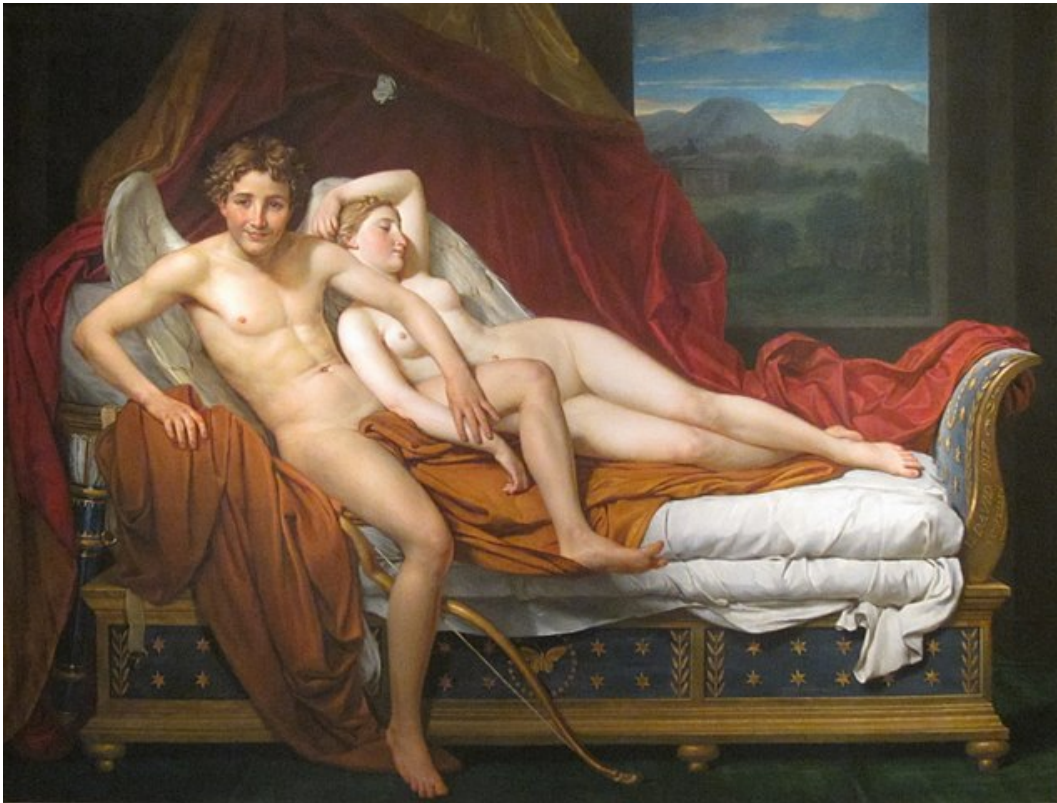
JACQUES-LOUIS DAVID: Cupid and Psyche (1817). Cleveland Museum of Art.

Die Antike scheint sehr viel freier im Umgang mit Sex, Erotik und Liebe gewesen zu sein. Allein schon die Unterscheidung von drei Geschlechtern im Symposion von PLATON ist ganz offenbar auf Augenhöhe mit aktuellen Debatten. Allmählich öffnen sich die gegenwärtigen Diskurse dieser Vielfalt im Liebesleben, die in den Mythen allerdings schon immer vorgelebt wurde.