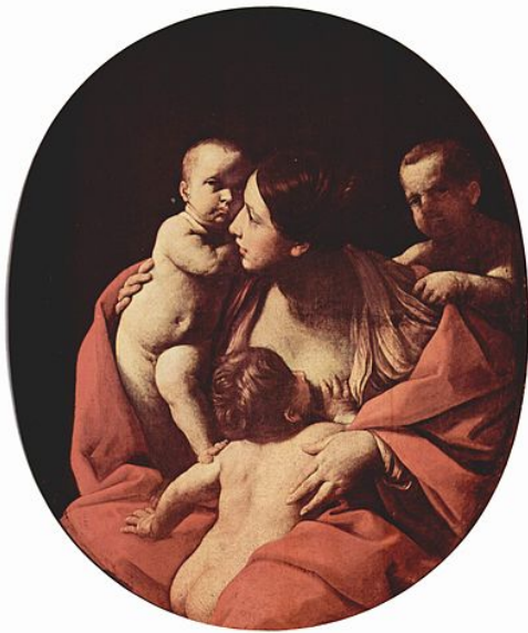
GUIDO RENI: Charity (1604f). Palazzo Pitti, Florenz.

›Heilig‹ erschien PLATON die Liebe auch in ihrer elementarsten Erscheinung bereits, weil sie gerade auch denen Flügel verleiht, die ansonsten ihre Bodenhaftung niemals verlieren. Insofern hat sie nicht nur etwas Anarchisches, sondern auch etwas Erhebendes. Menschen lernen sich selbst auf eine ganz neue Art kennen und nicht nur sie. — Folgt man dem platonischen Modell von den Stufen der Liebe, dann steigen wir wie Adepten schrittweise allmählich immer weiter auf.