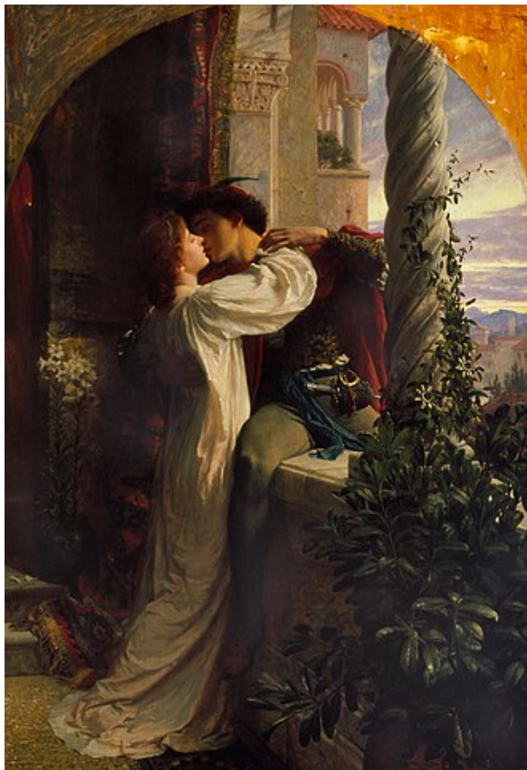
FRANK DICKSEE: Romeo and Juliet (1884). Southampton City Art Gallery.

Mythen bieten ganz großes Theater. Wer sich darauf einläßt, findet sich alsbald schon in einer sehr privilegierten Position, nahe genug am Geschehen, um alles mitzubekommen, aber weit genug entfernt, nicht selbst mit hineingerissen zu werden. — Mythen dienen unserem Anspruch auf Sinn, wenn sie mustergültig durchspielen, was der Fall gewesen sein könnte, um uns anstelle von Erklärungen eine Erläuterung anzudienen. Eben das macht Kultur und Bildung aus, anhand zeitübergreifender Motive einschlägige Erfahrungen zu machen, um Vielfalt und Komplexität würdigen zu können und nicht als Bedrohung empfinden zu müssen.