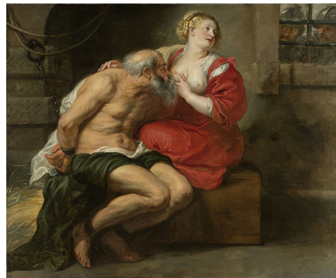
PIETER PAUL RUBENS: Cimon and Pero (um 1630). Rijksmuseum Amsterdam.

In einer Sammlung von erbaulichen Geschichten des VALERIUS MAXIMUS aus dem Jahre 30 n. Chr. findet sich als Beispiel für Caritas auch die Legende vom Seher CIMON, der zum Tode durch Verhungern verurteilt worden war. Nur seine Tochter PERO durfte ihn im Kerker besuchen, wurde aber von den Wachen auf eingeschmuggelte Lebensmittel kontrolliert. Darauf säugte sie den Vater und hielt ihn so am Leben. — Als der Tod nicht eintrat und die Richter schließlich davon hörten, reagierten sie beeindruckt und CIMON wurde begnadigt.