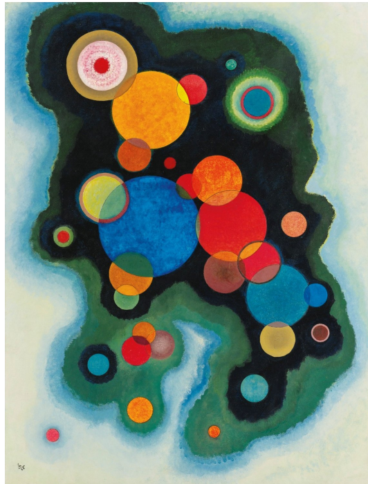
Wassily Kandinsky: Vertiefte Regung (Deepened Impulse) , (1928).

Im Hintergrund stehen Ideale wie Bildung, Entfaltung der Persönlichkeit, die Erfahrung erfüllender Arbeit und Erziehungsziele, die einer humanistischen Pädagogik entsprechen, bei der es eigentlich darauf ankäme, die Schüler besser gegen eine Gesellschaft in Schutz zu nehmen, die immer fordernder auftritt. In diesem Sinne steht auch nicht einfach nur Ausbildung , sondern eben Bildung auf dem Programm.